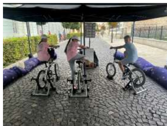
workshop Ekodoprava počas týždňa mobility