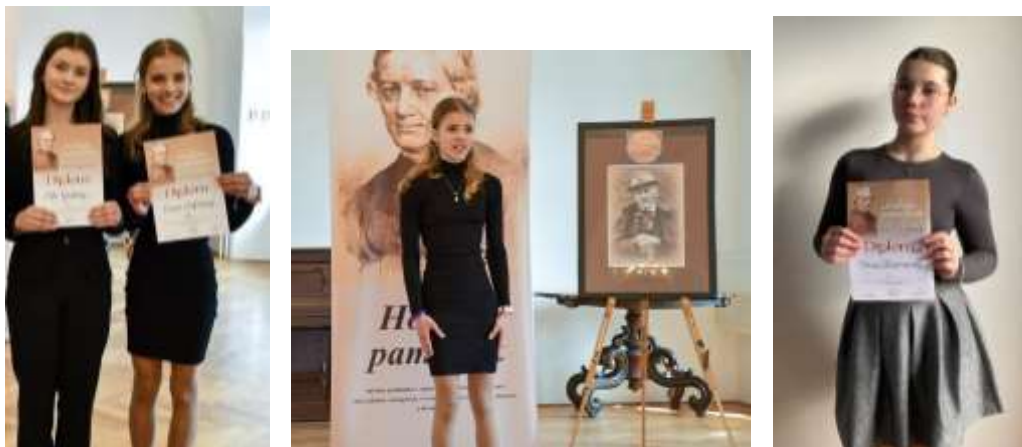
žiačky LDO ocenená za prednes v recitačnej súťaži Hollého pamätník 2024