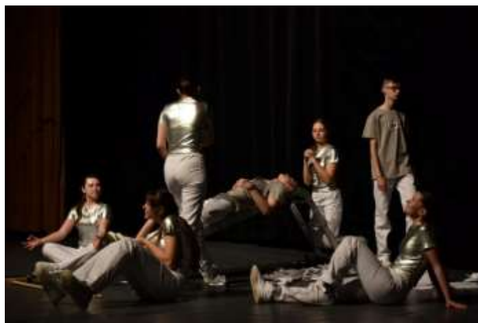
DDS Sabinky, divadelná inscenácia Kolo

DDS Sabinky, 2. miesto CVČ Divadlo očami detí, 2. miesto Senická jar, bronzové pásmo 51. ročník Zlatá priadka https://www.nocka.sk/zlata-priadka-2024-vysledky/