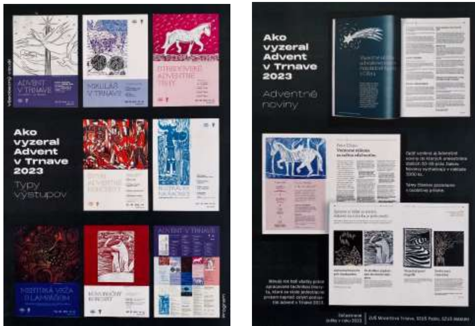
linoryty žiakov VO súčasťou programu Advent v Trnave 2023